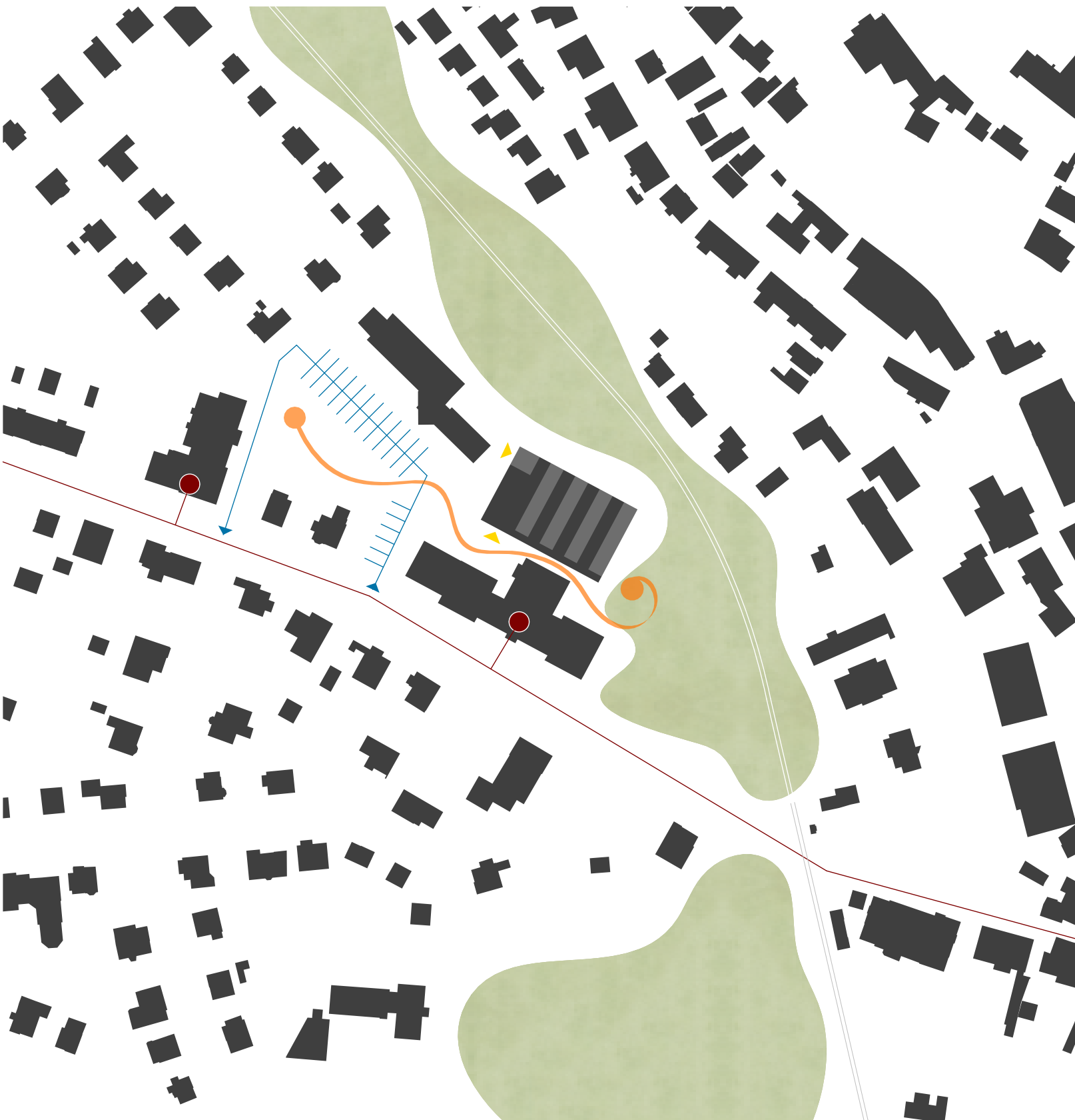
situace širších vztahů 1:2000